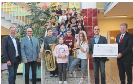
Instrumente für die Musikklasse