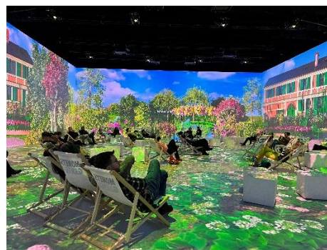
Immersive Kunstausstellung „Monets Garten“